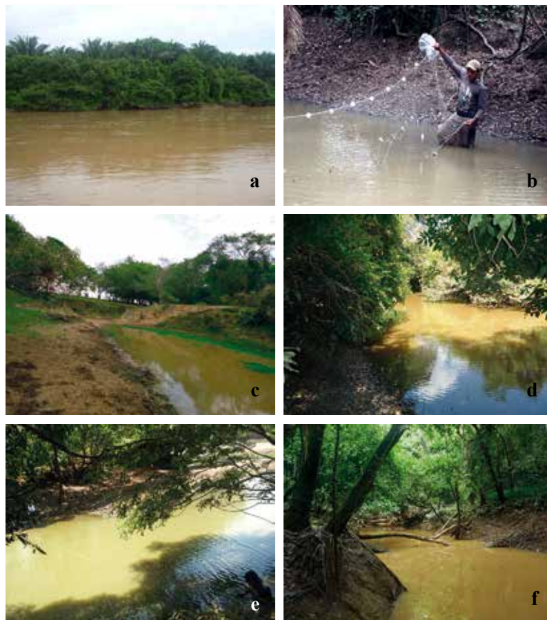
Figura 2. a) Río Pauto. b) Caño La Miel. c) Caño La Cañada. d) Caño Munipare. e) Caño Orosio. f) Caño El Indio.

Teniendo en cuenta las condiciones climáticas de la cuenca, fueron realizadas colectas en 2012 tanto en la época seca (diciembre-marzo, 20 días) como de lluvias (abril-julio, 20 días). Se seleccionaron caños que drenan sus aguas hacia el canal principal del río Pauto en su parte media y baja. En total fueron seleccionados 14 caños (Figura 2). En cada caño seleccionado se estableció un transecto de 100 m de longitud en el