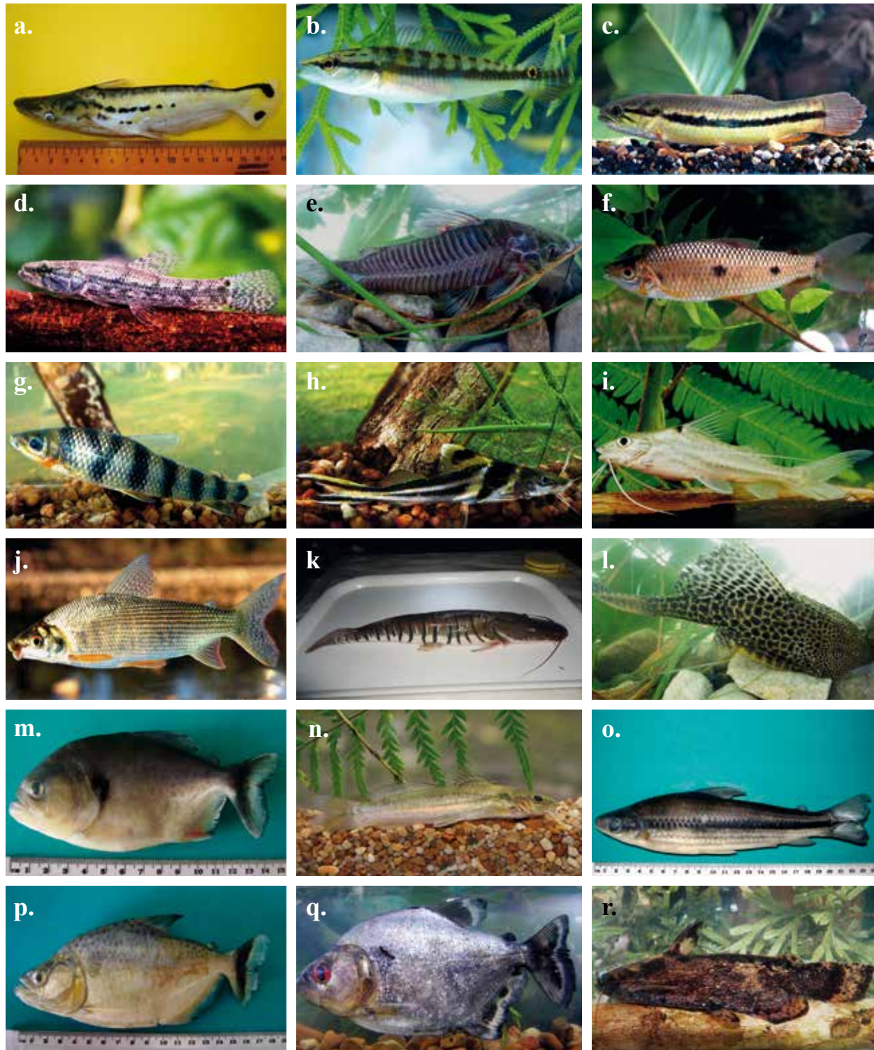
Peces de consumo regional. a. Ageneiosus magoi . b. Crenicichla cf. wallaci . c. Hoplerythrinus unitaeniatus . d. Hoplias malabaricus . e. Hoplosternum littorale . f. Leporinus gr. friderici . g. Leporinus yophurus . h. Pimelodus ornatus . i. Pimelodus bochii . j. Prochilodus mariae . k. Pseudoplatystoma orinocoense . l. Pterygoplichthys multiradiatus . m. Pygocentrus cariba . n. Rhamdia quelen . o. Schizodon scotorhabdotus . p. Serrasalmus irritans . q. Serrasalmus rhombeus . r. Trachelyopterus galeatus .