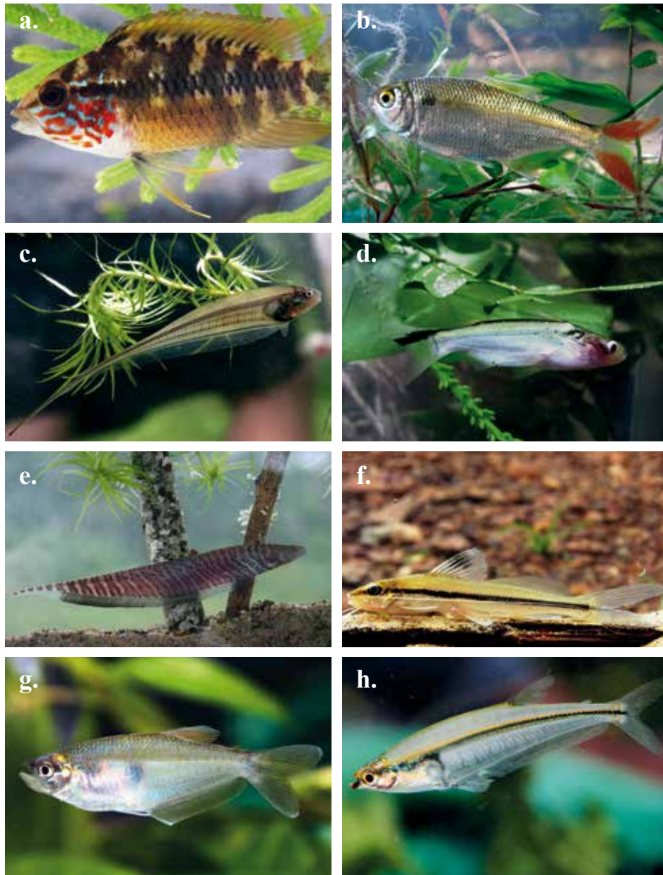
Peces ornamentales. a. Apistogramma macmasteri . b. Astyanax integer . c. Eigenmannia virescens . d. Entomocorus gameroi . e. Gymnotus carapo . f. Paragoniates alburnus . g. Pimelodella metae . h. Xenagoniates bondi .